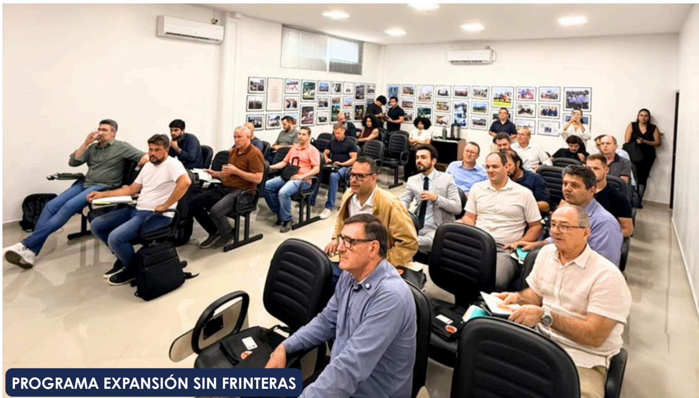
PROGRAMA EXPANSIÓN SIN FRINTERAS