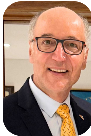
Por: Alex Hammoud.

Eventos como el Black Friday no solo rompen récords de ventas, sino que demuestran la capacidad logística de la región.